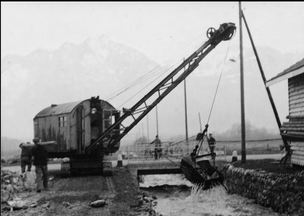
→ Endiguement d'une rivière, ca 1940-1950

Le vendredi matin, les conférenciers exposeront les enjeux de la revitalisation des cours d'eau et les objectifs de demain. L'après-midi sera notamment consacrée à la projection de films historiques conservés à la Médiathèque Valais - Martigny.